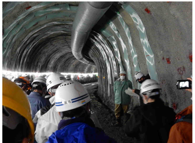
四国山地砂防事務所による説明