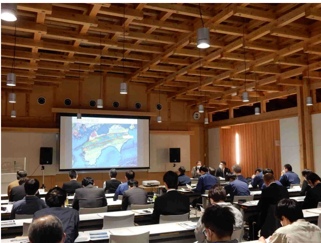
行政機関による取組説明

本取組を通して、地すべり対策技術の向上や普及を推進し、土砂災害の防止に万全を期して参ります。