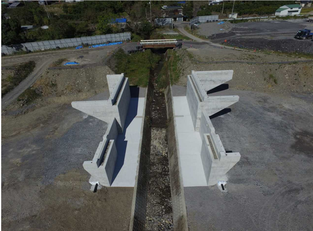
橋梁下部工(和田2号橋) 橋台工 N=2基 場所打杭工 N=12本 橋梁下部工(和田2号側道橋) 橋台工 N=2基 場所打杭工 N=8本 擁壁工 逆T型擁壁 N=2基