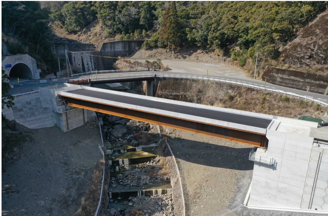
新池谷橋上部工 鋼単純少数鈹桁橋(橋長L=53.0m, 鋼重W=112.1t, 斜角=90°, 有効幅員W=7.5m) 製作工 N=1式 架設工 N=1式 橋梁付属物工 N=1式 舗装工 A=378m 2