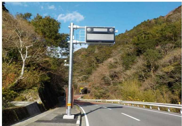
警報表示板 終点方