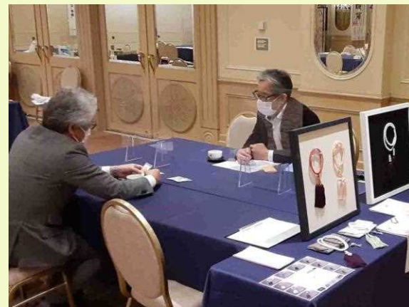
より具体的な商談が可能な 展示商談会も開催 (東京・名古屋・大阪各地で開催)