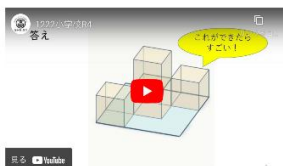
高知県算数・数学思考オリンピック 解説動画 算数編

令和4年度：平成23・24年度高知県算数・数学思考オリンピック問題から解説動画を掲載しています