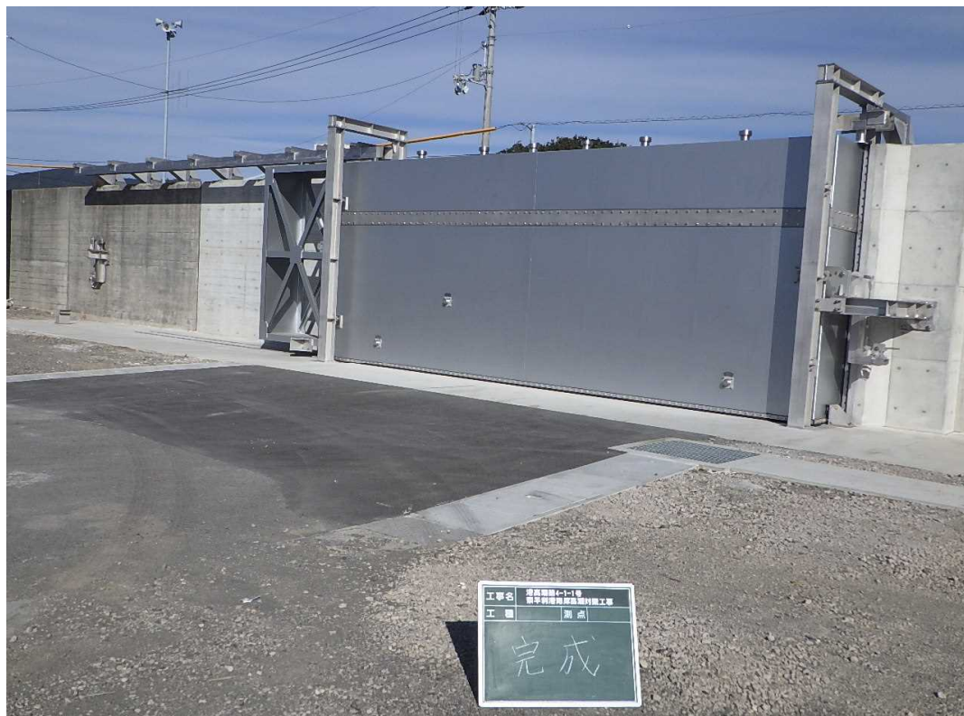
奈半利港海岸1号陸間 アルミニウム合金製引戸式ゲート N=1門