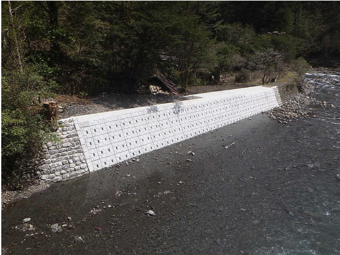
復旧延長 L=159m ブロック積(景観) A=748m 2 大型ブロック A=87m 2