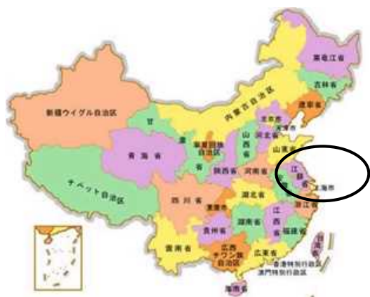
(2014.2更新 安徽省政府ホームページより)