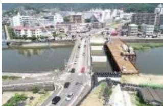
【都市計画事業】 高知駅秦南町線(高知市)