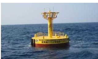
【魚礁事業】 足摺沖黒潮牧場18号