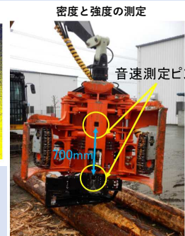
密度と強度の測定