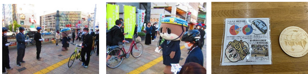
写真9 高知県高校生自転車ヘルメット着用啓発活動の様子と配布したノベルティグッズ

また、今回の啓発活動は、本校が交通安全推進の拠点校として、高知県高等学校PTA連合会や高知警察署、学校安全対策課にも協力を要請し、学校・保護者・警察・行政が連携して協力するモデルとすることができた。