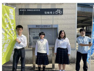
写真7 ヘルメット着用推進週間の様子