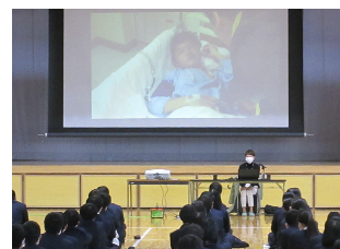
写真6 交通安全講演会

自転車ヘルメット着用の必要性・重要性を理解させるための講演会を開催した。講師には、自身の子どもがヘルメットの着用のないまま交通事故に遭い、一時意識不明の重体となった経験を通して、母親目線でヘルメットの重要性を語ってもらった。ヘルメットを着用することで、命を失うリスクを大きく減らすことができることを理解させ、自発的にヘルメット着用に向けて行動するきっかけづくりとした。