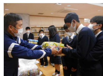
写真8 ヘルメット着用キャンペーン