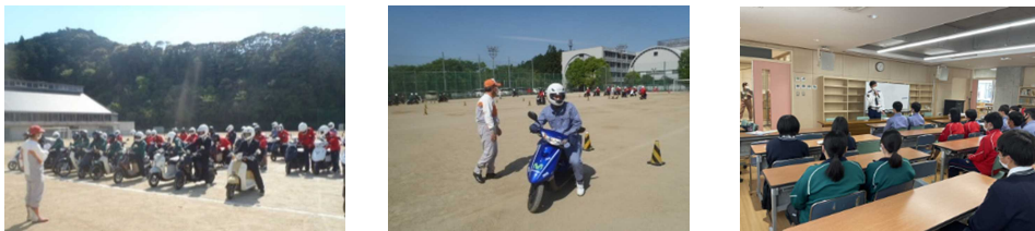
写真3 原付バイク安全講習会

本校は、通学が不便な地域の生徒に対して条件を定め、原付バイクによる通学を特別に許可している。原付バイクによる事故を未然に防ぐため、原付バイク安全講習会を4月に実施し、原付バイク通学生以外は、同日の同時時間帯に、自転車ヘルメットの着用指導を中心に自転車安全講習会を実施した。