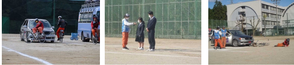
写真2 スケアード・ストレイト教育技法による自転車交通安全教室

本校グラウンドで、自転車交通安全教室を実施した。スタントマンが実際の事故の再現を行い、参加者に事故の危険性を視覚的に体験してもらった。恐怖を実感することで、それにつながる危険運転を未然に防止し、交通ルールの大切さを学ぶ取組となった。