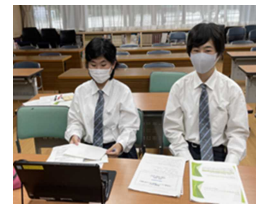
写真4 サイクルサミット (オンライン開催)

宮城県が主催した「みやぎ高校生サイクルサミット2021」がオンラインで開催され、本校の交通安全推進委員2名が参加した。2名は、本校のこれまでの交通安全の取組を発表し、宮城県の高校生と情報交換することで、自分たち以外にも自転車ヘルメットについて活動している高校生がいることを知り、励みになった。