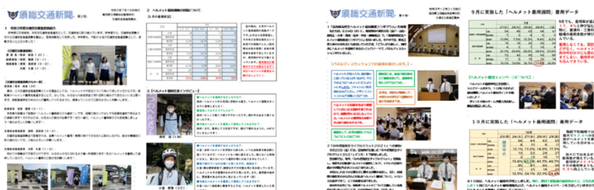
写真5 交通安全新聞

今年度は、自転車ヘルメットの着用問題に絞って紙面を構成した。紙面では、ヘルメット着用生徒のインタビューや交通安全推進委員の取組、本校で開催されたシンポジウムなどについての紹介を行った。自校の生徒や保護者、教員に対して、ヘルメット着用に関する課題の共有と、取組への理解・協力を求め、交通安全に対する意識の向上を図った。