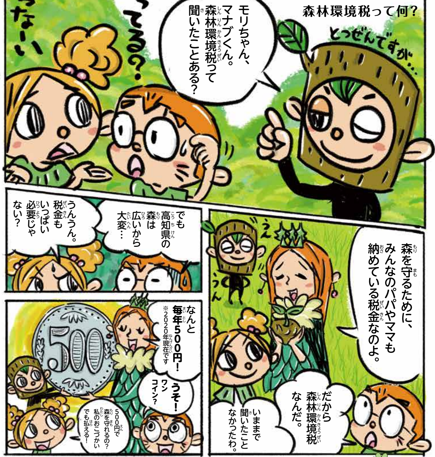
高知県は、県民みんなが参加する森づくりを進めるため、平成15年に全国に先駆けて森林環境税を導入したのよ。