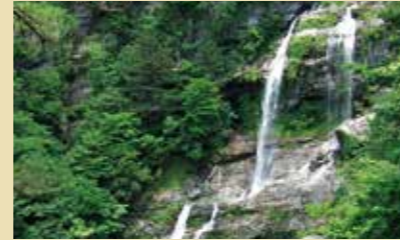
敷地内にある4つの滝は、それぞれが迫力満点。