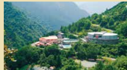
愛媛県境に近い海拔750mの大自然。