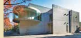
建物は、世界的な建築家・安藤忠雄氏による設計。