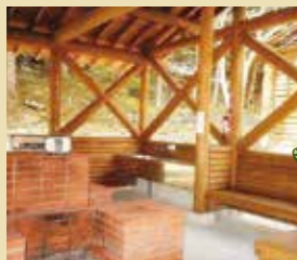
屋根付きの多目的スペース。