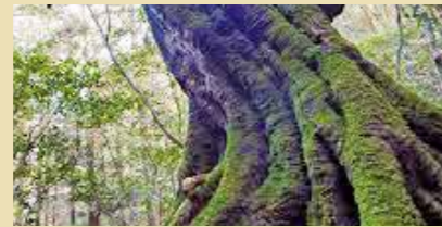
原始の森が広がり、神秘的で歴史が息づく横倉山。