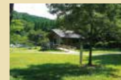
キャンプ場のご利用は事前に連絡が必要です。