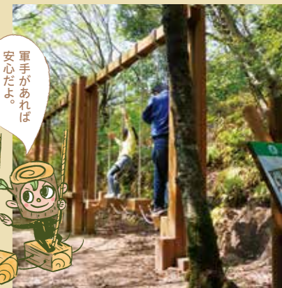
小さい子でも遊べるアスレチックがいっぱい。