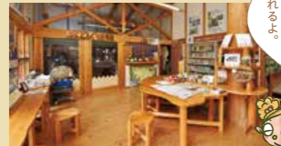
どんぐりを貯められる「どんぐり銀行」本店。