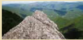
白鷲山から望む四国山地の山並。