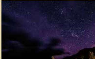
夜空はまるでプラネタリウム。