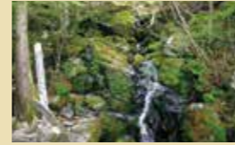
ここは四万十川源流点のある町。