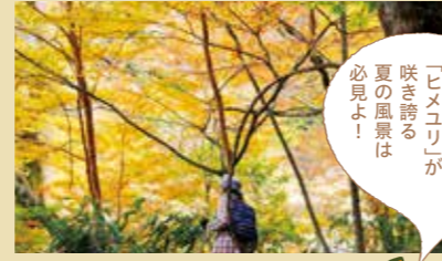
美しい自然のセラピーロード。