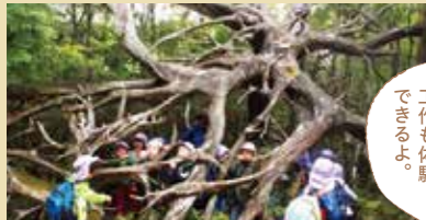
風倒木の根。大自然のパワーに圧倒されます。