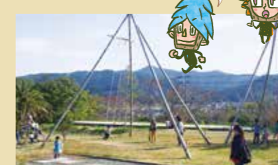
南側の芝生にある高さ約8メートルの竹のブランコ。