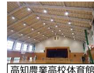
高知農業高校体育館

学校体育館の避難所機能を維持するよう、県立学校体育館の非構造部材等の耐震化を実施