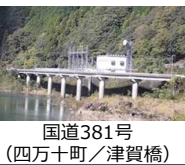
国道381号（四万十町／津賀橋）