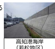
高知港海岸（若松地区）