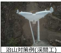
治山対策例（溪間工）

【対象箇所】 ・治山事業等 大豊町西庵谷 ほか24箇所 ・森林整備事業 ・林道改良事業等 間伐面積1,750ha 亀谷小石川線 ほか15箇所