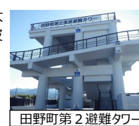
田野町第2避難タワー

【事業費】3,064百万円 【対象箇所・実施期間】 南国市前浜 ほか22箇所（H24～H28）