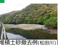
堆積土砂撤去例（松田川）

【対象箇所】 ・物部川 ほか65箇所 【R2事業費】822百万円（R元比3.8倍）