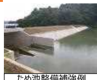
ため池整備補強例

【対象箇所】 ・南国市中部1期地区 ほか15地区 【3か年事業費】3,159百万円