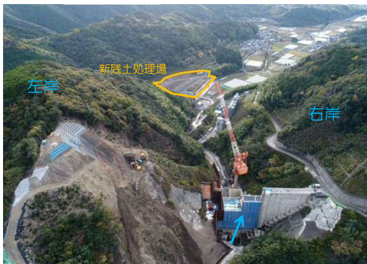
下流からみたダムサイト