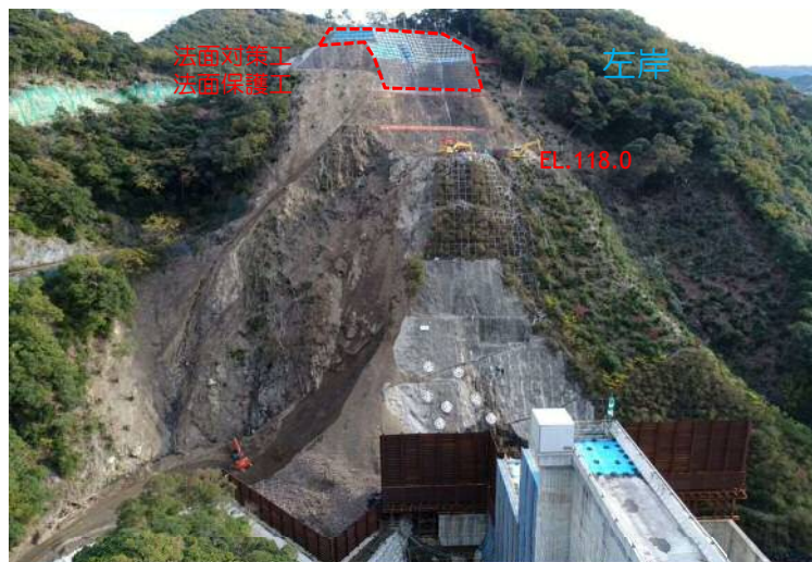
右岸より左岸を望む

和食ダムは、引き続き左岸再掘削を進めており、1月末時点で掘削予定高約100mのうち45m切下げたEL.118mを施工中です。来年のGW頃には掘削高さEL.100.0mに達する予定で、タワークレーンの使用が可能となりますので、下流側からの土砂運搬を開始でき、作業効率の向上が見込まれます。