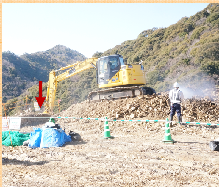
左岸頂部(左写真の )

頂部( )から掘削土を落としています。(高低差約90m) 下の集積ヤードにある程度土砂がたまれば、残土処理場へ運搬します。