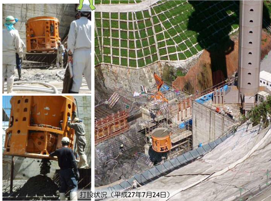
打設状況（平成27年7月24日）