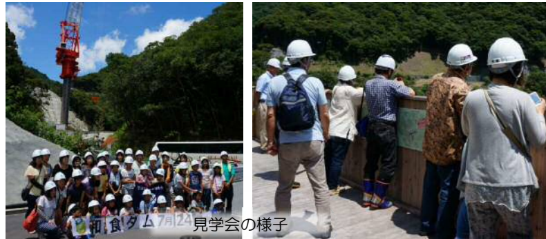
和食ダム7月24日見学会の様子

平成27年6月29日にダムマイスター、平成27年7月24日に日本建設業連合会四国支部が、和食ダムの現場見学に訪れました。コンクリート打設前ということもあり、今しか見れない貴重な現場状況を肌で感じてもらうことができました！