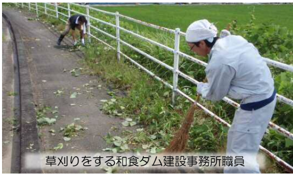
草刈りをする和食ダム建設事務所職員

6月21日は、芸西村内のゴミ拾いや清掃活動を行う「環境の日」でした。今年も和食ダム建設事務所では、工事関係車両が通行する道路沿いにおいて、繁茂している雑草の草刈りを行い、芸西村を美しくする手伝いをさせていただきました。