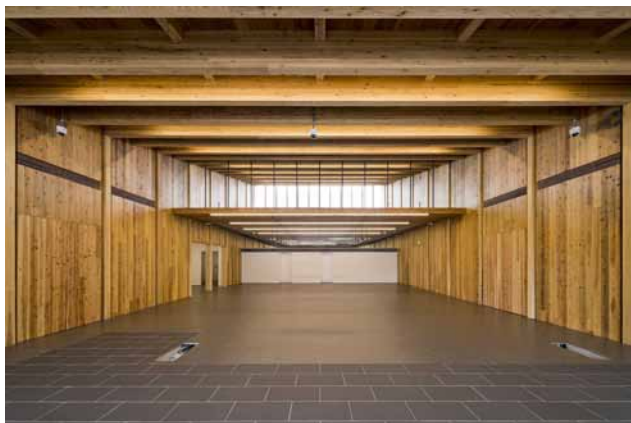
宿毛商銀信用組合本店・宿毛支店