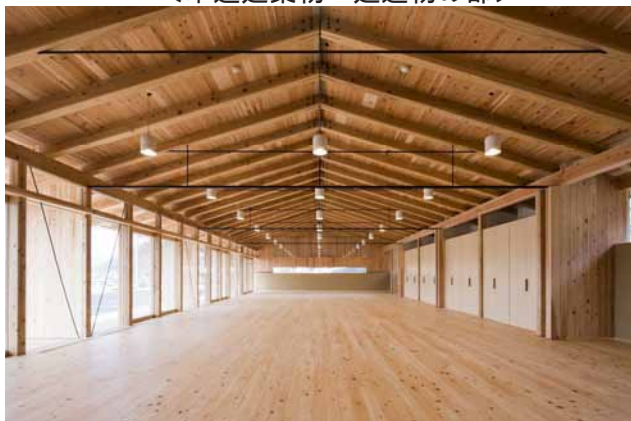
黒岩地区集落活動センター