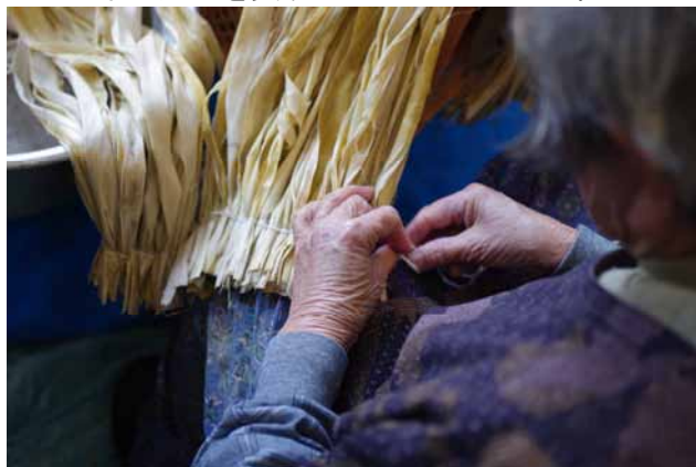
黒潮町佐賀北部活性化推進協議会