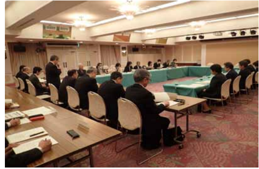
高知県環境審議会の様子（平成29.2.6）