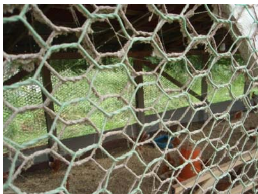
網目2cm以上のネットを二重にしている例

A. 屋外の運動場も含め、飼養する区域全てを防鳥ネットでカバーすることが難しい場合でも、家きん舎や給餌・給水場所には防鳥ネットを設置するなどして、野鳥等との接触の可能性を最小限にしてください。