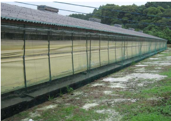
家きん舎全体を覆う防鳥ネット