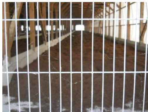
幅の狭い金網で小型鳥類の侵入を防止している例