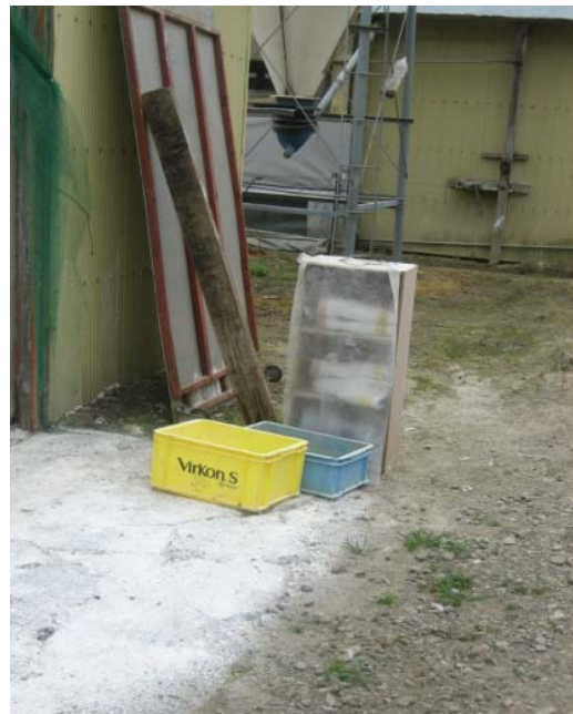
衛生管理区域及び家きん舎専用の衣服(白衣)と長靴の設置例