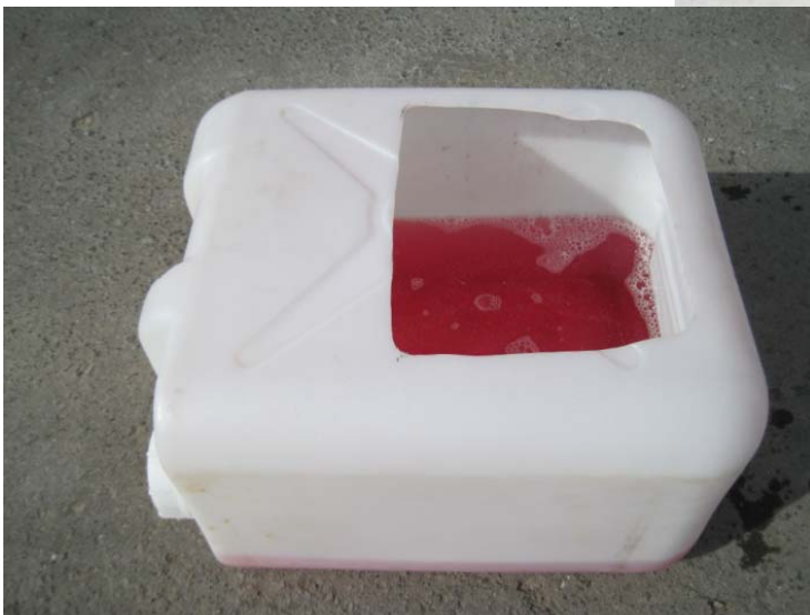
ポリタンクを改良した長靴用消毒容器