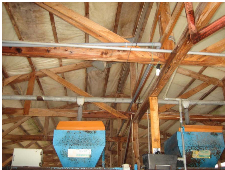
清掃が行き届いた家きん舎の例