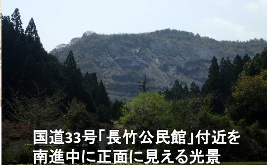
国道33号「長竹公民館」付近を南進中に正面に見える光景

最終候補地 ※四方を山に遮られており、国道からは見えない場所にあります ※地元の方からは「ネコダケ」と呼ばれている石灰岩採掘跡地です