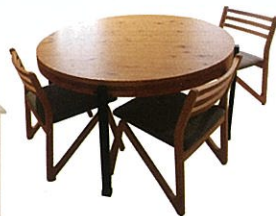
CLT家具展示 ※写真はイメージです