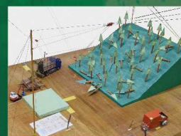
林業架線 (H型集材) 模型