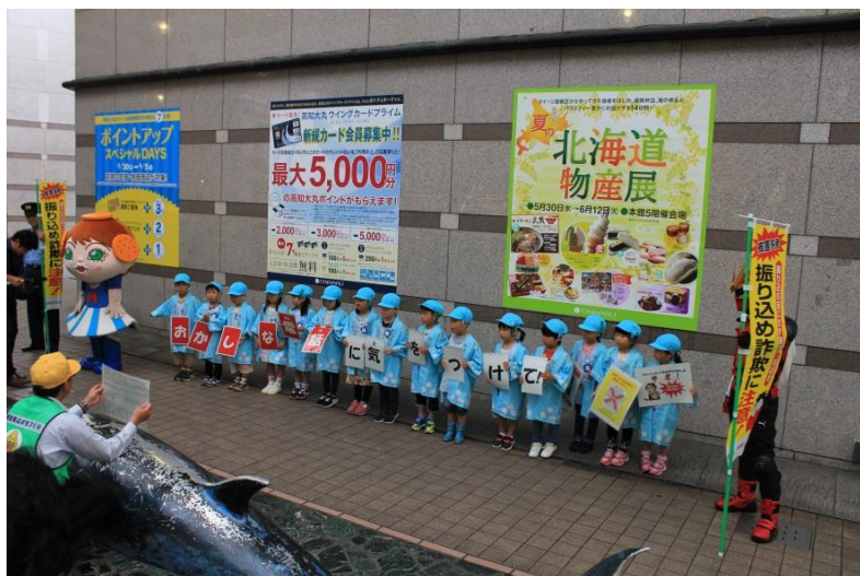
元気な声で被害の防止を呼び掛けました!