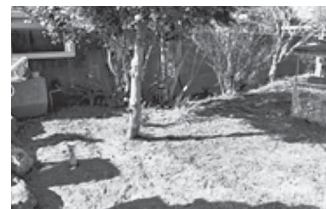
終了時の現場の様様