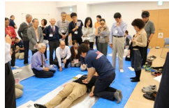
[高知県:医師向け災害医療研修の様子]