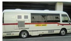
[高知県:災害用資機材を搭載した健診バス]

さらに 最困難課題地域への対応策を見出していく必要 ①完全孤立の無医地域 ②長期浸水地域