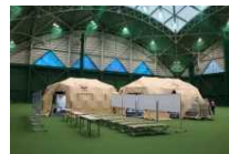
[高知県:SCUへの資機材整備]