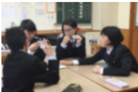
図1 中1の活動の様子

は、「友だちが気付いてくれて良かった」などと伝え合うことの良さを感ずることができていた。