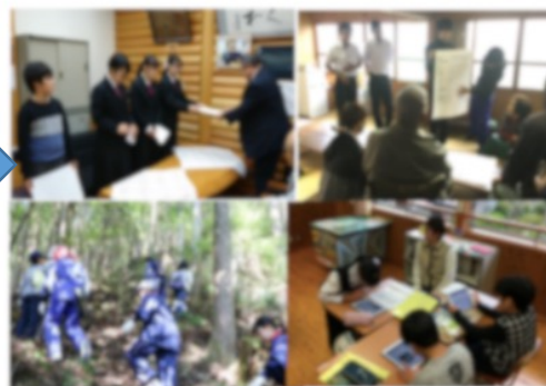
図7 小中合同総合の活動の様子