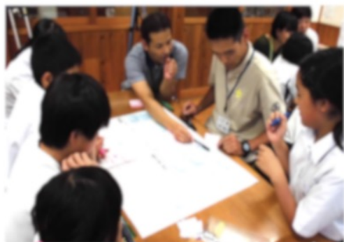
図6 地域の方とのワークショップ

チームに入ってそれぞれが分かれたことがすごく良かった。まず話をしたことを目の前の人に話すことワークショップの最後の発表の時に前に出て話を子どもがすることによって責任が生まれ、それを他の児童生徒に伝えざるを得ない必然性と継続性が生まれる。 即興性 というか、急に話を振られても話ができるように多少はなってきた。前で発表することになっても、 物怖じせずに発表することができていた 。ニコニコしながら発表できていた。