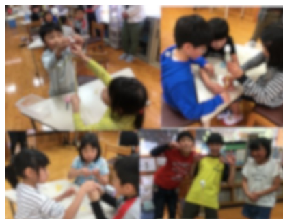
図4 小学生の活動の様子