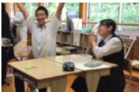
図3 中学生の活動の様子

5月に全中学生、全小学生を対象に実施。マシュマロチャレンジは、知識理解だけでなく、コミュニケーションを発揮しながら創るものであり、コミュニケーション・協力がないと出来ない。またコミュニケーションの取り方が良いチームが成果をあげていることがわかった。そして、「ふりかえり」の時間を十分とったことで、チームを超えて、コミュニケーションをとることができ、次の活動への意欲と見通しを持つことができた。「マシュマロチャレンジ」は主体的・対話的で深い学びになる教材になるのではないかと期待される。