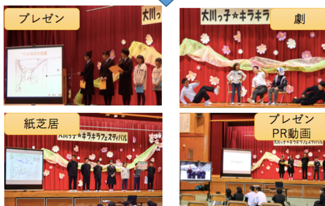
図8 キラキラフェスティバル当日の様子

プレゼンテーションの内容については、①テーマやその設定理由、昨年度からのつながりについて、②地域の人・もの・こととの関わりを通して、課題発見や解決方法を模索し、提案しているのか、③全体の活動を通して、コミュニティーの一員として、私たちができることは何か、の3点を各チームが入れてプレゼンテーションをするよう提案し、探究的・継続的な学び（深い学び）につながるよう提案した。そして当日はそれぞれの方法でコミュニケーションポイントと相手を意識することを意識しながら表現することができていた。来場者からの以下のようなコメントを得た。