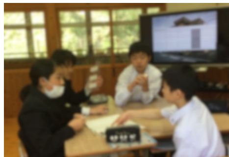
図2 中2の活動の様子