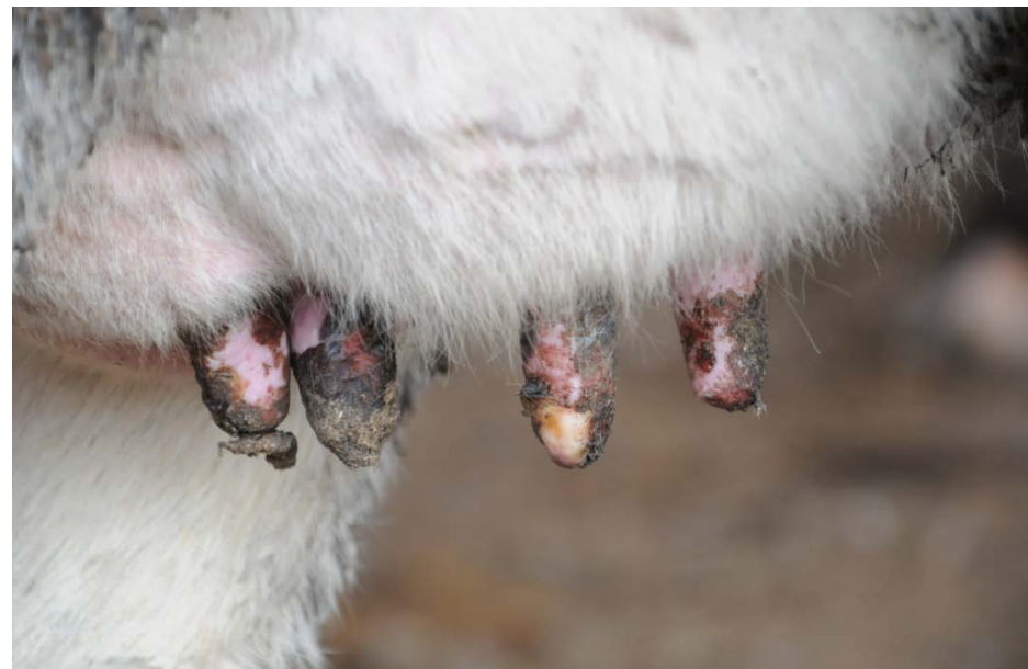
乳頭のびらん、痂皮(ホルスタイン種)