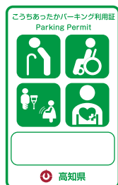
身体障害者等、 けが人、妊産婦(緑)