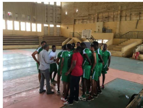
青年男子バレーチーム。ほとんどが190センチを超えています。