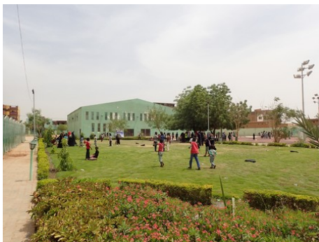
お奥にはスーダンでは珍しい体育館。

できない理由をつければ色々言い訳はできますが、私は私ができることを全力でするんだ、と子どもたちの笑顔に毎回励まされています。