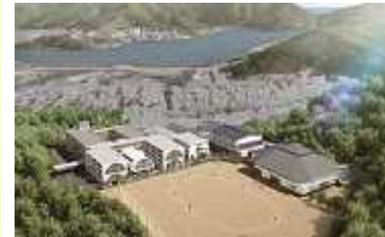
北西側からの全景

体育館に必要な高さとして12mを確保しつつ、外周部に向かい徐々に低くなる 台形断面 とし、競技に必要な空間をコンパクトに確保することで、外壁面積を最小限とした。 寄棟型 の屋根形状で、軒を低く抑え、端部を斜めとし、北側グラウンドに対する日影の影響を最小限に抑えている。