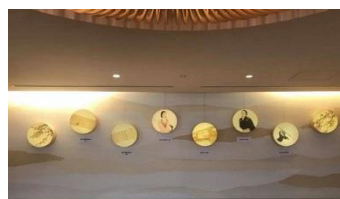
「アクトランド」プロデュースパネル