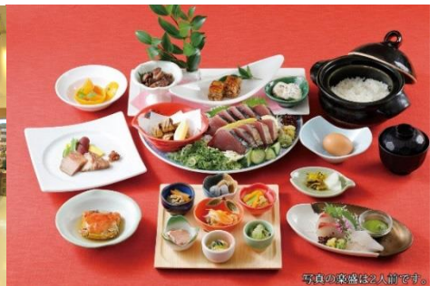
平食の業務は2人前です。