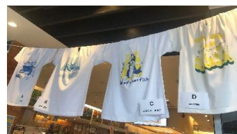
「WE LOVE 高知」

高知県内で開催されている「志国高知 幕末維新博」と連動し、4月の県立坂本龍馬記念館のオープンに合わせて「やっぱり龍馬が好き!」と題し、香南市にある「アクトランド」プロデュースのパネルを2階レストランの壁に設置し、物販では龍馬グッズの特設販売を行いました。