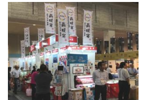
フードストアソリューションズフェア2018