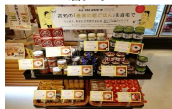
逸品コーナー (最高の朝ご飯)