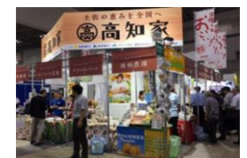
第11回居酒屋産業展