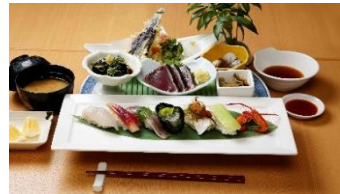
にぎり鮭の彩り皿鉢