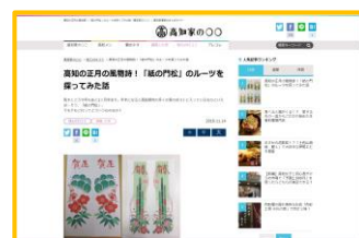
高知家の〇〇 「紙の門松」のルーツを 探ってみた話

地上波をはじめとしたテレビ番組タイアップ企画により、広い層に対する情報拡散を図ります。