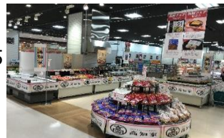
イトーヨーカドーアリオ橋本 「高知フェア」