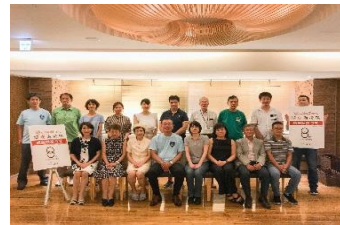
「関東海援隊」感謝状贈呈式