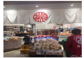
しなまつり(名古屋 高知屋)