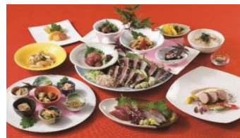
秋のコースメニュー