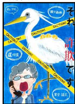
【中学生・高校生の部】