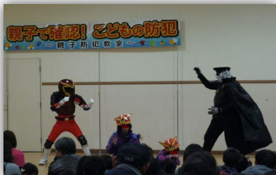
マモルマンに子どもたちも大興奮！