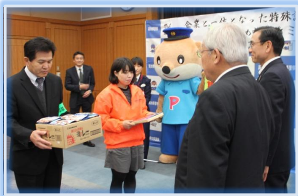
警察本部での贈呈式の模様（3月18日）