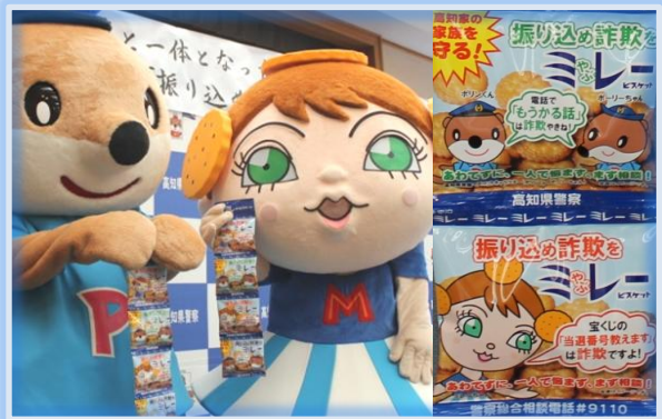
振り込め詐欺防止を呼びかけるミレービスケット

商品は4袋1セットで県内の量販店等で販売されており、売上の1%は公益社団法人高知県防犯協会に寄付され、防犯ボランティア団体の支援に充てられるとのことです。