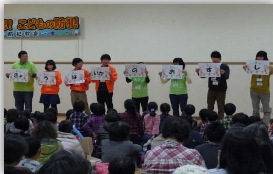
大学生ボランティアも参加しました

高知市では、「高知市安全で安心なまちづくり条例」に基づく推進体制として「高知市安全で安心なまちづくり会議」を設置しており、関係機関等と連携・協力しながら犯罪等を未然に防止し、安全で安心して暮らせるまちづくりの実現に向けた取組を進めています。