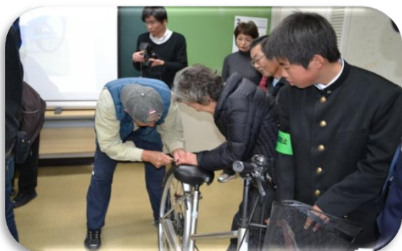
実技を通して防犯を呼びかけました