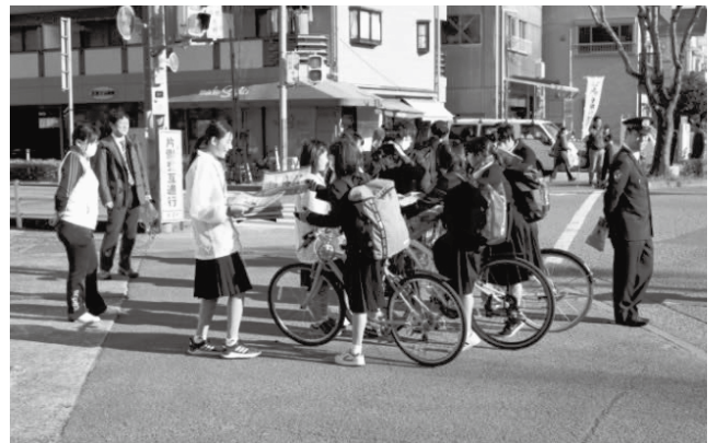
← 当日配布された啓発チラシ (岡豊高等学校 漫画・アニメ部の生徒さんがデザイン)

参加者は、登校中の中高生等に対して、啓発チラシを手渡ししながら、ネットの安全利用について注意を呼び掛けました。