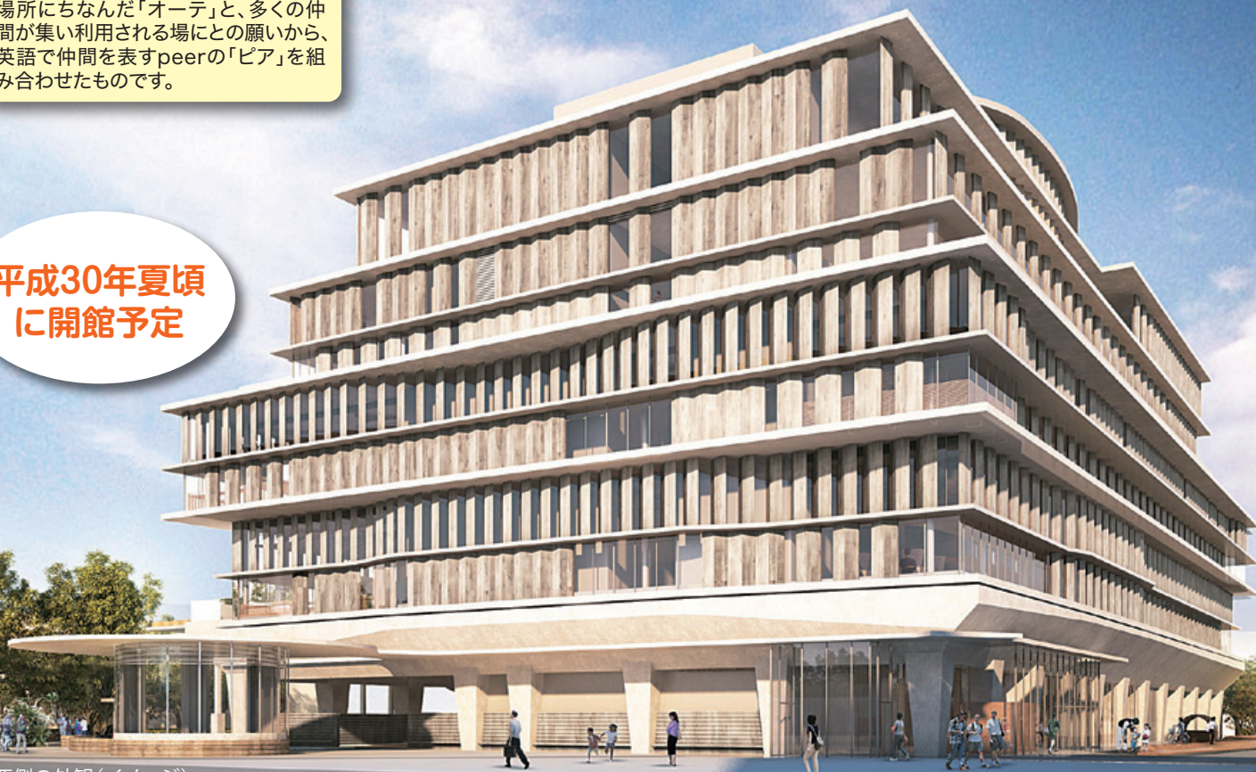
南西側の外観(イメージ)

オーテピアが多くの県民市民に親しみを持って利用していただけるよう、パンフレット、ホームページ、標識、案内サインなどに使用するロゴマークを募集します。