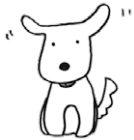
知るぼるとキャラクター 矢口イチ(矢口家の愛犬)