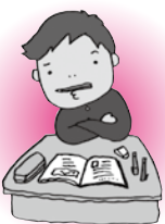
知るぽるとキャラクター かぐら じゅんぺい (矢口家の長男)

Q 「NISA(少額投資非課税制度)」口座への年間投資額の上限は、平成28年1月以降、いくらになったでしょうか。