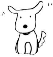
知るぽるとキャラクター 矢口イチ(矢口家の愛犬)