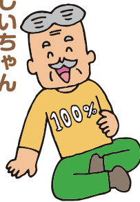
おしいちゃん 亀次(通称かめじい)

亀市の弟で、かつては公務員をしながら絵を描いていた。県展で特選経験あり。昔はカメラにアウトドアにとよく遊んでいた。