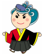
大会マスコットキャラクター 土佐なる子