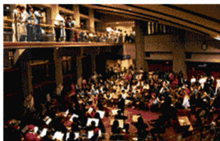
たくさんの方が聴きにきてくださいました

会場設営・患者さん誘導等のボランティアの方、募金にご協力くださった職員の方、どうもありがとうございました。おかげで、会場の飾りつけも華やかになりました。次回もよろしくお願ひします。