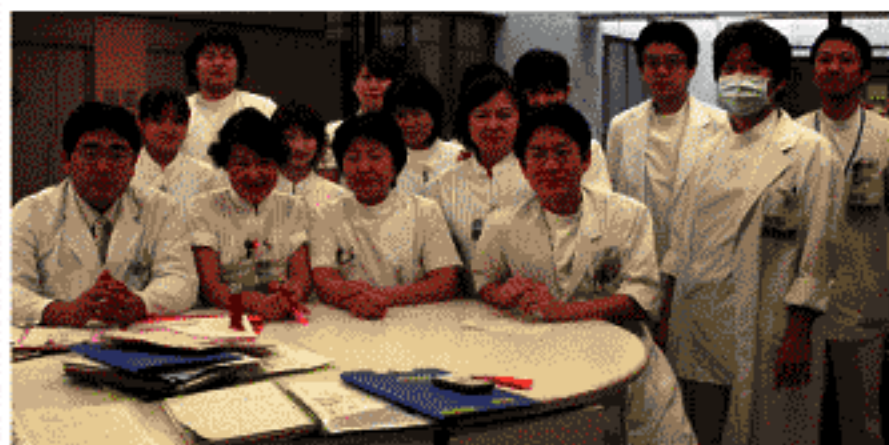
東6のスタッフです